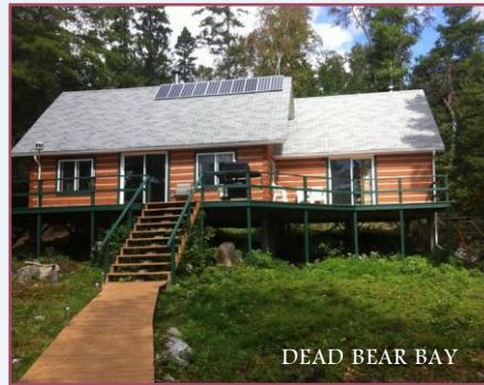
DEAD BEAR BAY

All of our outpost cottages are fully equipped with electric fridges and grid or solar power.