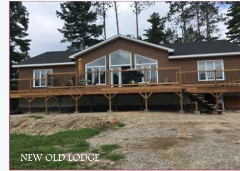
NEW OLD LODGE